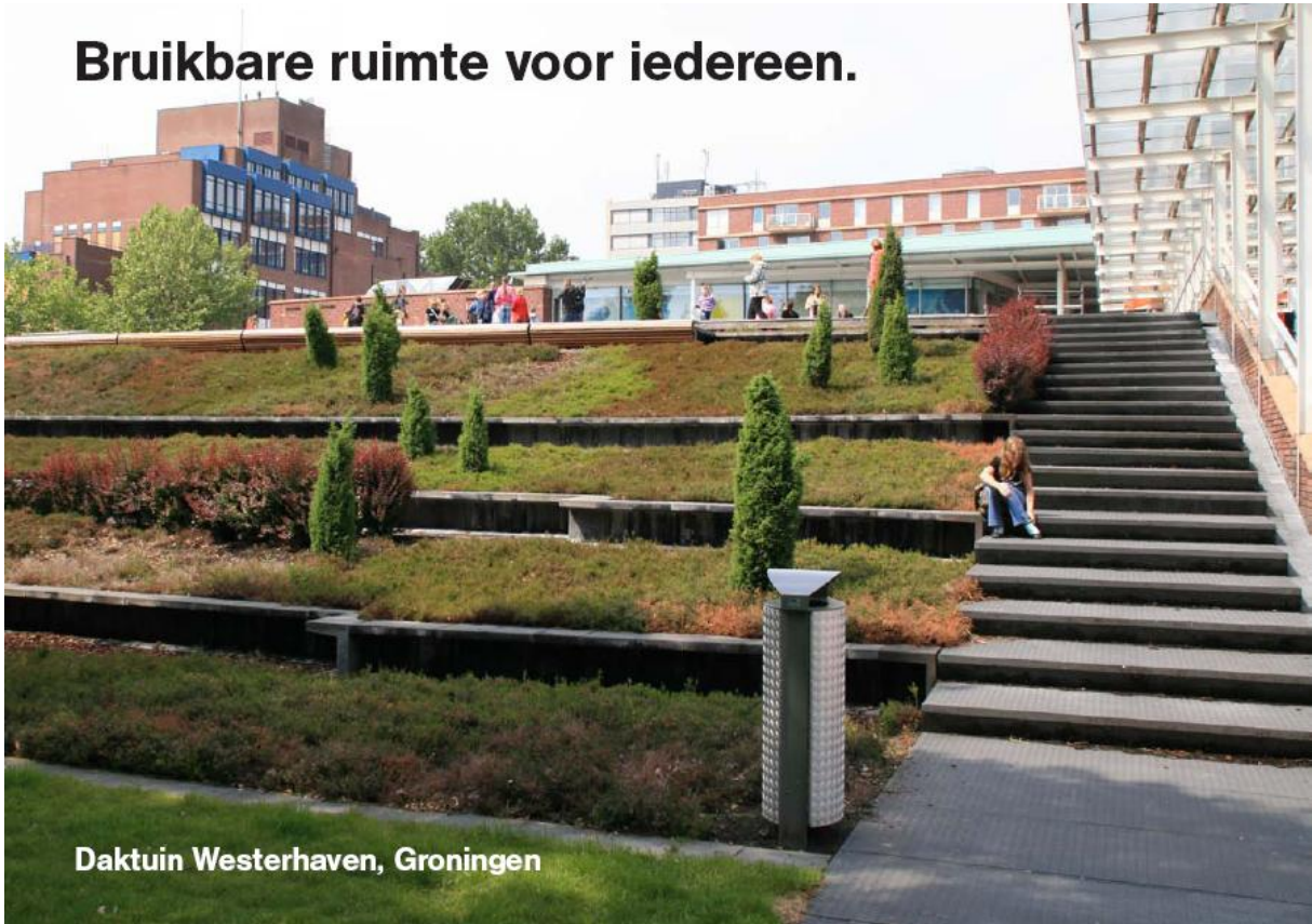
Daktuin Westerhaven, Groningen