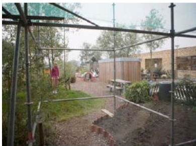
Educatief Centrum Harkstede Samen met ouders