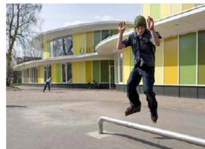
De Vlinder ter Apel Samen met wijk

MFA Thorbeckepark Met andere ontwerper (Delta Vorm)