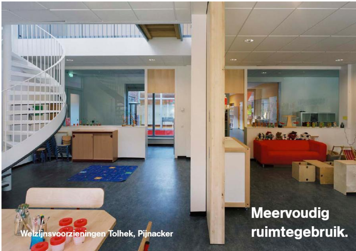
Welzijnsvoorzieningen Tolhek, Pijnacker