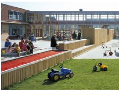
De Bonte Tol Pijnacker Samen met gebruikers